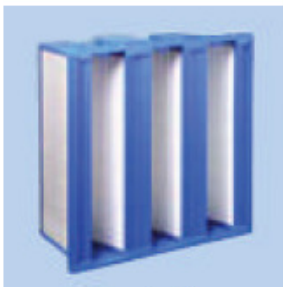
Suodatin Vakiona F9 taskusuodatin (19 m 2 ).