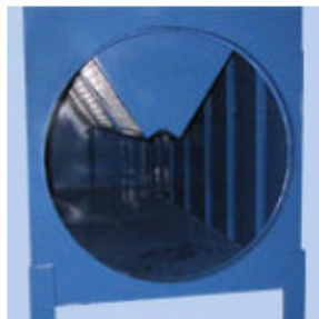
Rasvasuodatin Pestävä alumiininen rasvasuodatin.