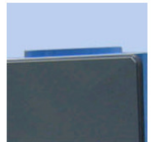
Liituskappale Liituskappale toimitetaan vakiokokoisena. Muut koot ja paikat lisämaksusta.